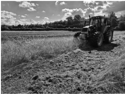
Figura 4: trinciatura della matrice erbosa con catena da 8 mm