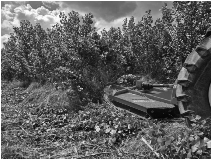
Figura 5: trinciatura dei polloni di pioppo con catena da 13 mm