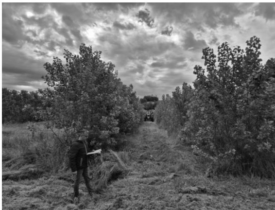
Figura 1: piantagione MRF presente al CREA IT di Monterotondo

Le prove sono state condotte in una piantagione Medium Rotation Forestry (MRF) di pioppo presso il CREA-IT sede di Monterotondo in un appezzamento di terreno pianeggiante (Fig.1) dal 6 all'8 Maggio 2025.